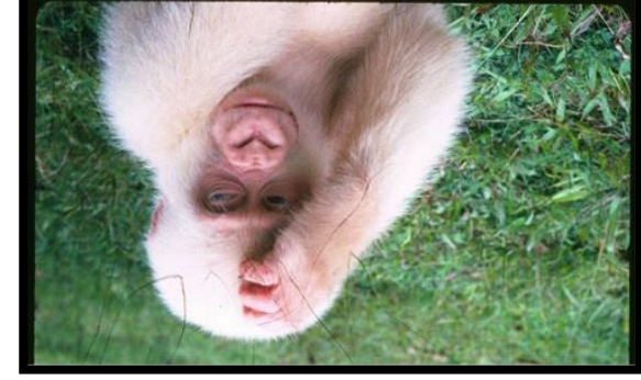
Col·lecció Dr. Sabater Pi - Naturalista (Universitat de Barcelona)

Així doncs, l'MDC us oferirà suport en la important tasca de difondre les col·leccions especials de la vostra biblioteca.