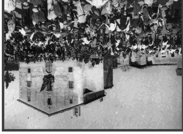
Col·lecció Estudi de la Masia Catalana (Centre Excursionista de Catalunya)

L'MDC és un repositori cooperatiu, en funcionament des del 2006, des del qual es poden consultar, en accés obert, col·leccions digitalitzades relacionades amb Catalunya i el seu patrimoni o que formen part de col·leccions especials d'institucions catalanes. Està obert a la col·laboració de biblioteques i arxius de Catalunya que desitgin difondre i donar la màxima visibilitat a les seves col·leccions especials.