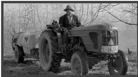
El món agrari a les terres de parla catalana (Coordinadora de Centres d'Estudis de Parla Catalana)