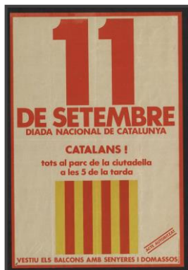
Cartells polítics (Universitat Autònoma de Barcelona)